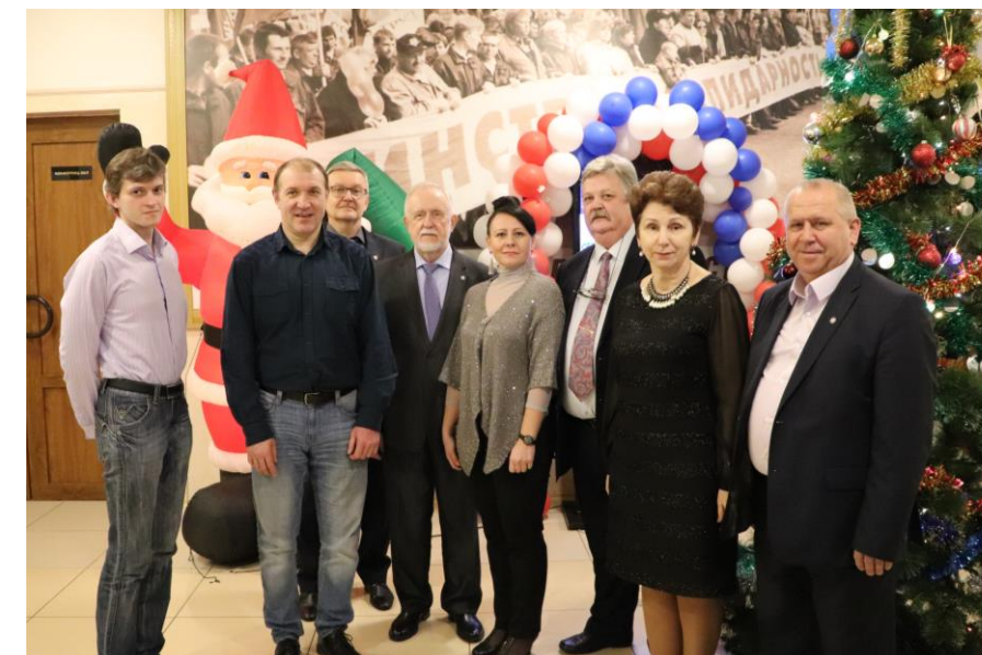
Делегация Московской области

Вот и тема для нашего следующего молодёжного форума.