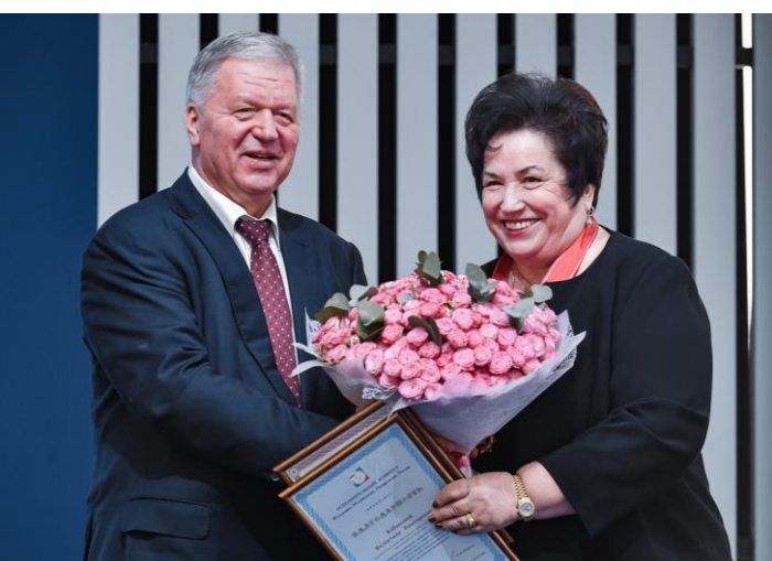
Цветы и награды от Председателя ФНПР

- Профсоюзные организации Московской области всесторонне участвуют в создании условий для развития рынка труда, снижения социального неравенства, соблюдения гарантий достойного уровня жизни работников и членов их семей.