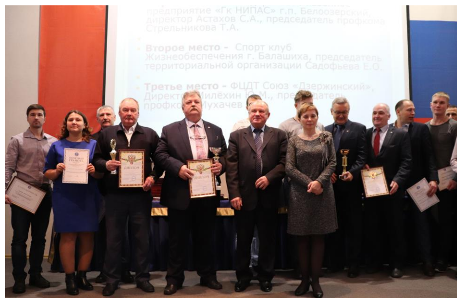
Профсоюзные руководители и спортсмены РОСПРОФПРОМ с почётными наградами